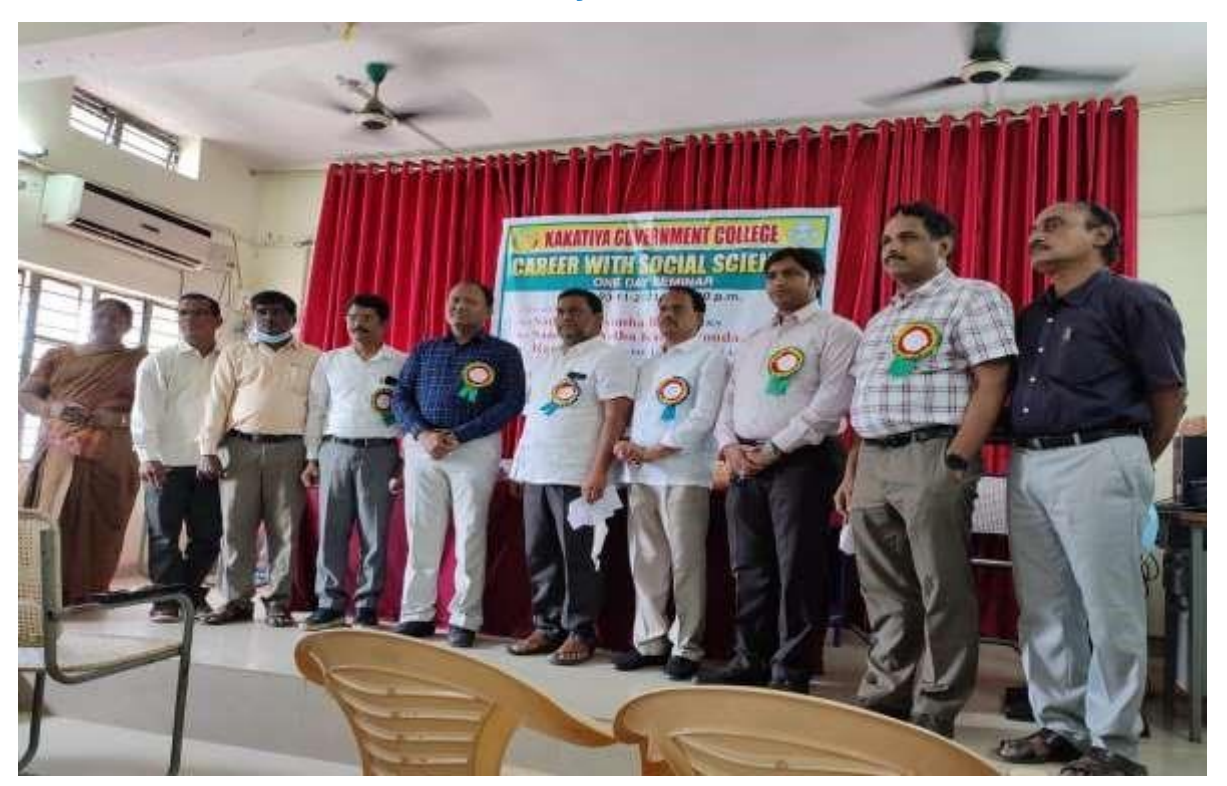
The faculty members of Social sciences with Resources persons